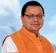
Pushkar Singh Dhami Chief Minister