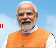
Narendra Modi Prime Minister